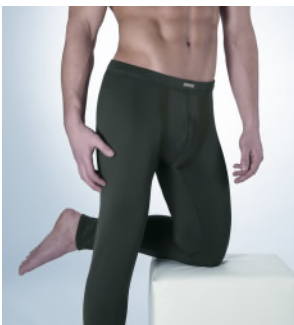
Art. 1804– 3011 Hose lang ohne Eingriff M-3XL