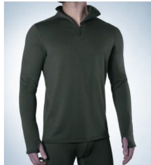
Art. 1807 – 3011 Jacke 1/1 Arm mit Zipper-Kragen M-3XL