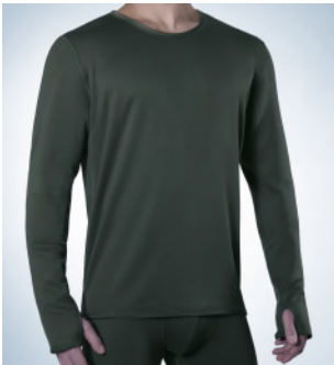
Art. 1806 – 3011 Jacke 1/1 Arm M-3XL