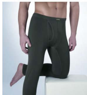
Art. 1805 – 3011 Hose lang mit Eingriff M-3XL