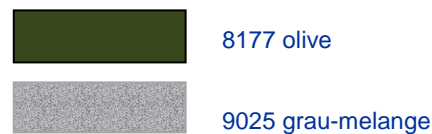
Art. 1010 – 5095 Sturmhaube (ohne Abb.) M/5 8177 olive