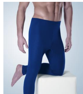
Art. 1008 – 5095 Hose lang ohne Eingriff S/4 – XXL/8 0101 weiß S/4 – XXL/8 0172 marine S/4 – XXL/8 9025 grau- melange