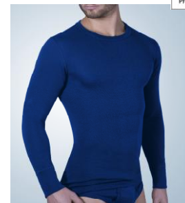
Art. 1005 – 5095 Jacke 1/1 Arm im Frackschnitt M/5 – XXL/8 0172 marine M/5 – XXL/8 8177 olive M/5 – XXL/8 9025 grau- melange