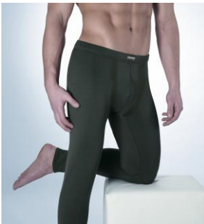
Art. 1804– 3011 Hose lang ohne Eingriff M-3XL