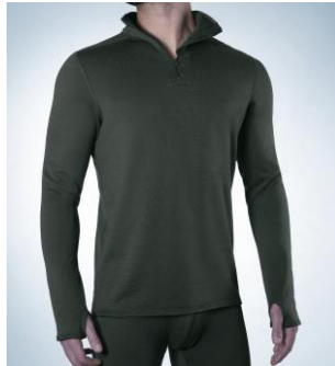
Art. 1807 – 3011 Jacke 1/1 Arm mit Zipper-Kragen M-3XL