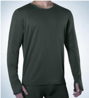
Art. 1806 – 3011 Jacke 1/1 Arm M-3XL