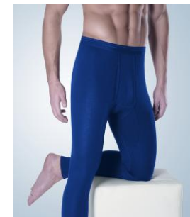
Art. 1005 – 5095 Hose lang mit Eingriff M/5 – 3XL/9 0172 marine M/5 – XXL/8 8177 olive M/5 – XXL/8 9025 grau- melange