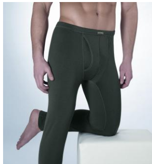
Art. 1805 – 3011 Hose lang mit Eingriff M-3XL