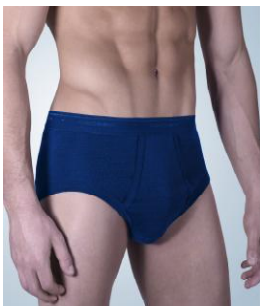
Art. 1004 – 5095 Slip mit Eingriff M/5 – XXL/8 0101 weiß M/5 – XXL/8 0172 marine