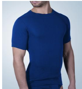
Art. 1007 – 5095 Jacke ½ Arm im Frackschnitt S/4 – XXL/8 0101 weiß S/4 – 3XL/9 0172 marine M/5 – XXL/8 8177 olive S/4 – XXL/8 9025 grau- melange